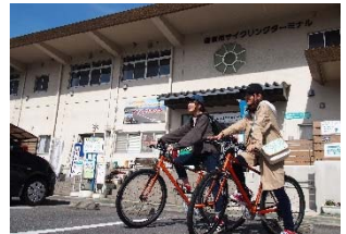
↑国東市サイクリングターミナル