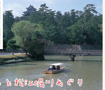
ぐるっと松江堀川めぐり