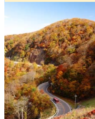
高野龍神スカイライン