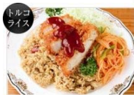
長崎育ちの「トルコライス」